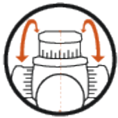
Seitenverstellung links oder rechts