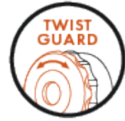
TWIST GUARD Verdrehschutz