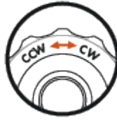
Verstellrichtung CW oder CCW