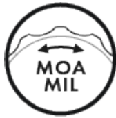
MOA oder MIL